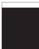
Baksida 225x273 mm +5 mm utfall 29 700 kr