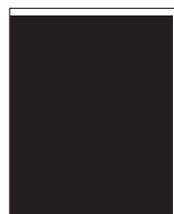
Bilaga Hela 215x288 mm. Maxformat om inget annat överenskommit. Upp till 30 gr. 1.15 kr