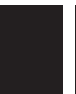
Uppslag 2x225x298 + 5 mm utfall 35 800 kr