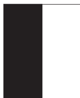
Halvsida stående 105x297 mm +5 mm utfall 14 000 kr