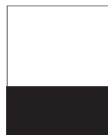
Halvsida liggande 210x148,5 mm +5 mm utfall 14 000 kr